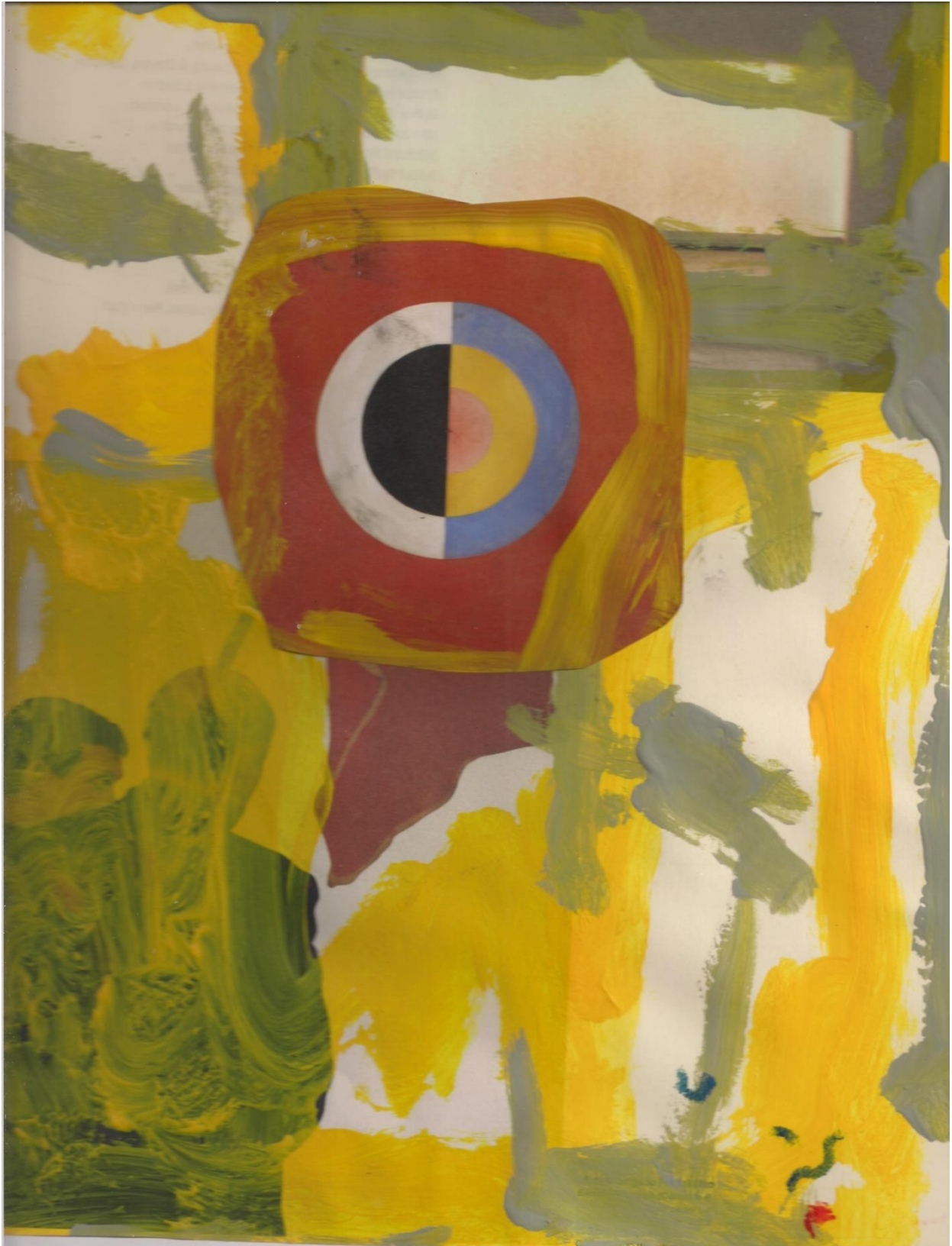
Thorkild Ranum 2019